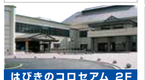
はびきのコロセアム 2F