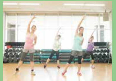
GUNZE体操 準備体操に最適!