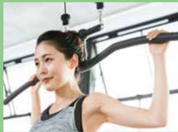
マシントレーニング

※初月途中入会の場合は、2ヶ月目の月会費0円! 初月は途中入会割引が適用されます。 ※別途、登録手数料5,500円(税込)が必要となります。 ※入会から7ヶ月間が安心サポート期間です。 ・途中解約される場合は通常料金との差額を頂戴いたします。