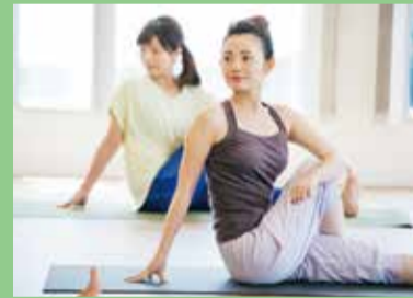
フィットネス パワーヨガ