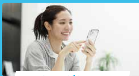
マイページシステム

100%平面駐車場(180台)が3時間無料でお使いいただけます! お隣がスーパーなので、お子さまの練習中にお買物も♪